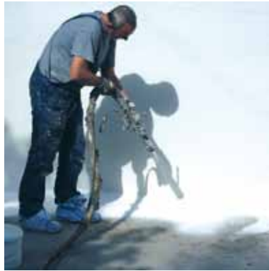
Applicazione spray di una piscina